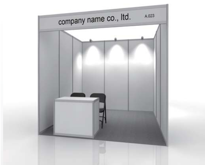
圖2：標準攤位立面示意圖