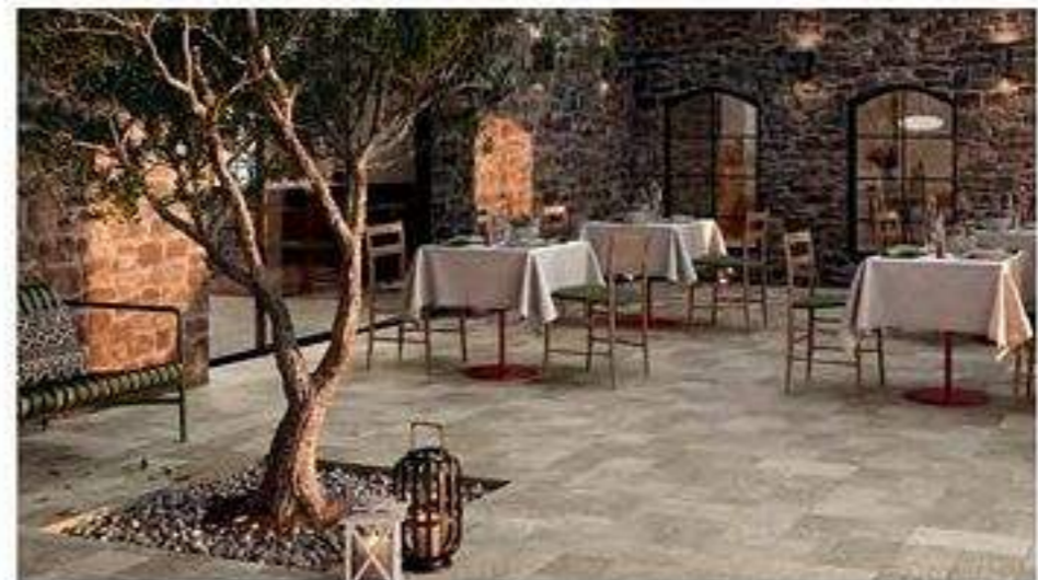
外裝地磚，圖 / 羅特麗瓷磚