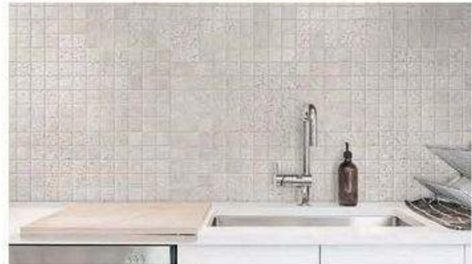
內裝馬賽克壁磚