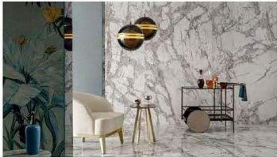
內裝壁磚，圖 / 漢樺磁磚