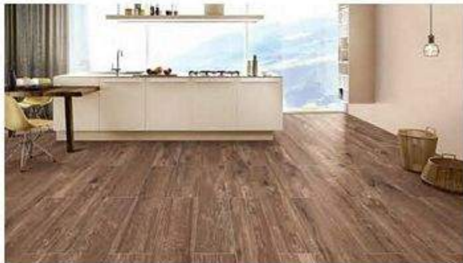
內裝地磚，圖 / 永大建材